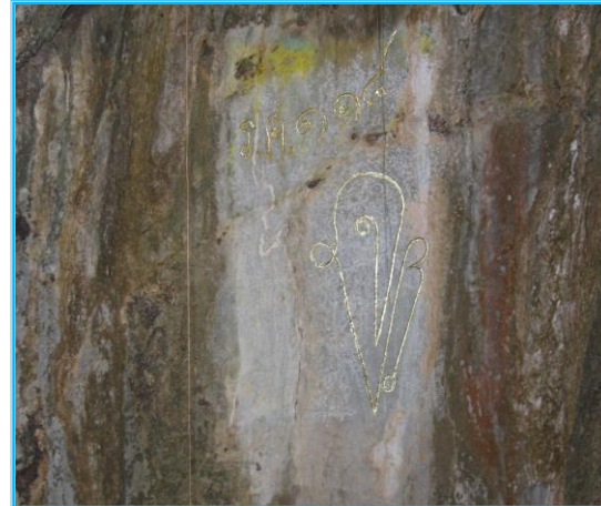
พระพุทธรูปภายในถ้ำสาริกาและพระปรมาภิไธย ย่อ จปร. ปี ร.ศ. ๑๑๘ (อยู่บริเวณหน้าถ้ำ)